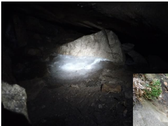
Lód zaobserwowany 3 maja 2018