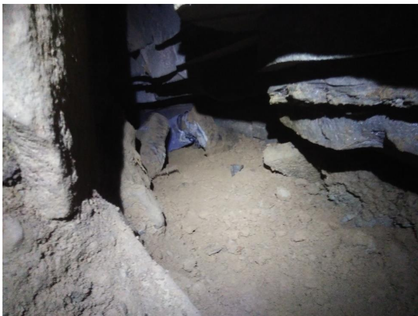
Korytarzyki w okolicy wejścia