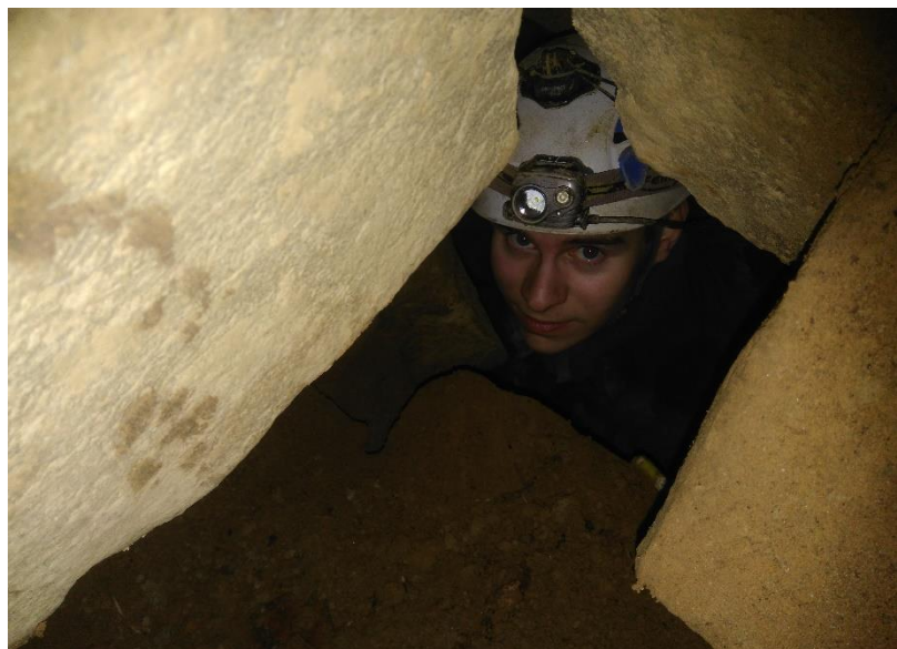
Zacisk Łamacz Kręgosłupa