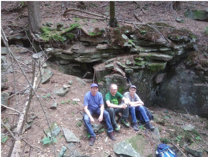
Rów przy otworze

wzrasta. Na końcu znajduje się studzienka sprowadzająca do nowych partii. Pokonanie studzienki jest uciążliwe ze względu na to, że w połowie trzeba się obrócić w ciasnym przejściu. Poniżej znajduje się Korytarz Pawła o długości ok. 7 metrów, wysokość osiąga ponad 3 metry. W kierunku NW na końcu korytarza znajduje się ciasna szczelina nie do