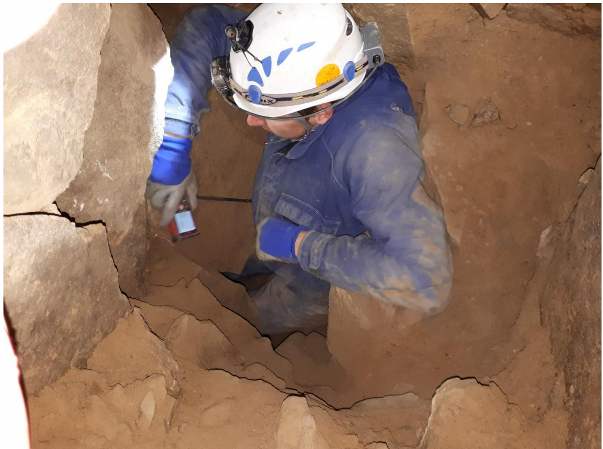
Wejście do nowych partii