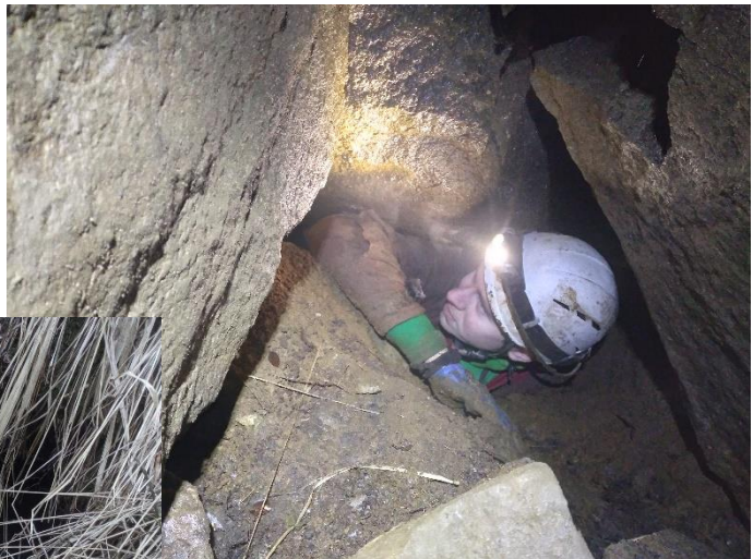
Wyjście z Niskiej Salki