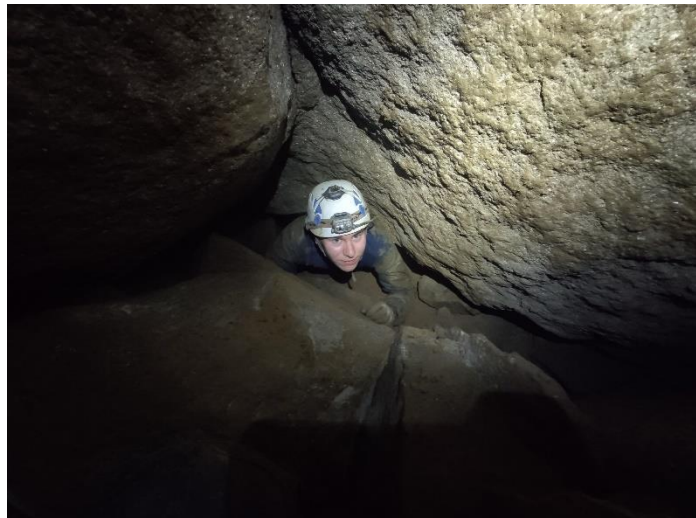
Poniżej Sali Pochyłej

Jaskinia osuwiskowa, powstała w piaskowcach warstw