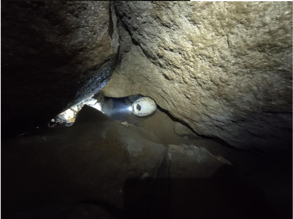
Poniżej Sali Pochyłej