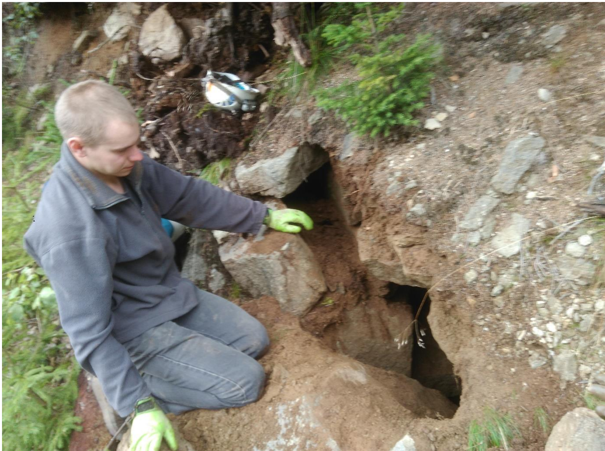
Otwór w trakcie eksploracji