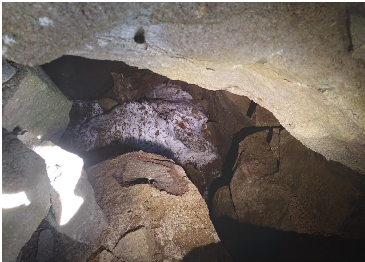
Resztki śniegu i lodu we wrześniu 2022