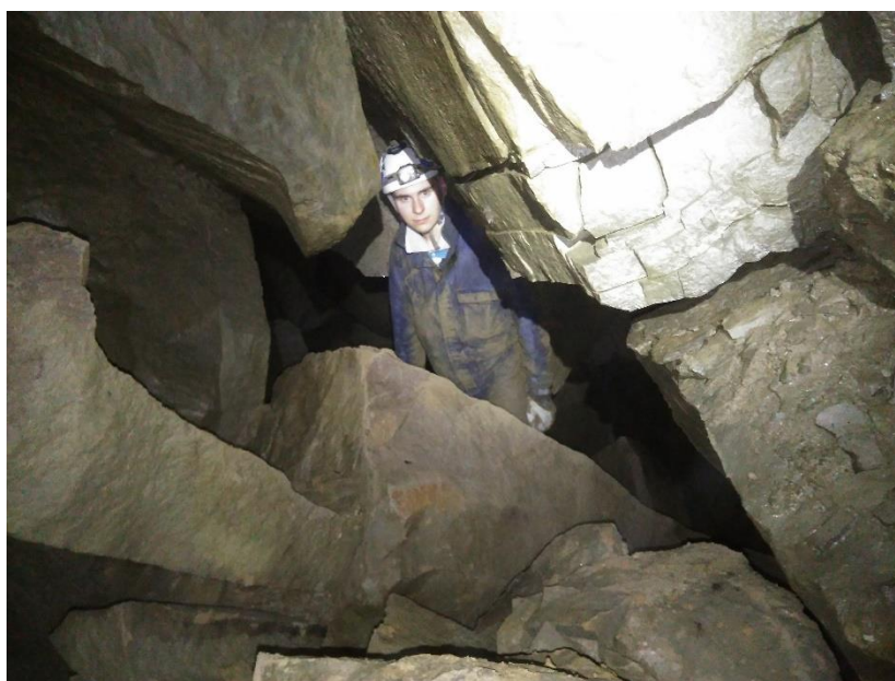
Wejście do Sali Kątowej

1. Na S po pokonaniu progu do góry wchodzimy do niewielkiej salki dalej wznoszącej się ku górze. Na jej końcu przez bardzo ciasną studzienkę o głębokości 1,8 m schodzimy do Korytarza z Mostem. W środku jest