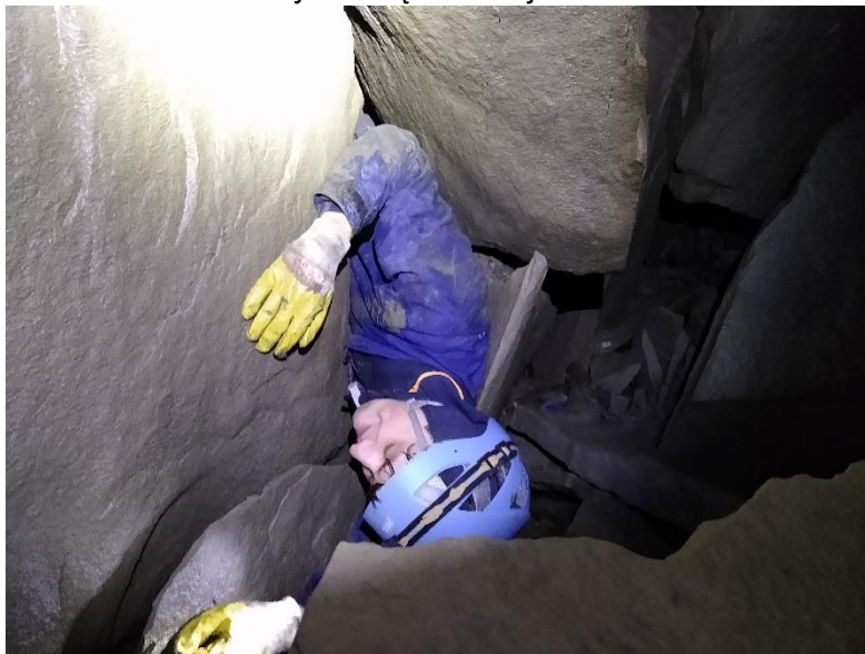
Zacisk przed Salą Pawła

wznosi się do góry, jest to bardzo niestabilne i kruche miejsce. Idąc dalej na W napotykamy studzienkę o głębokości 3,1 m. Jest bardzo ciasna, podczas wychodzenia ekstremalnie trudna. Tu znów korytarz się rozdwaja.