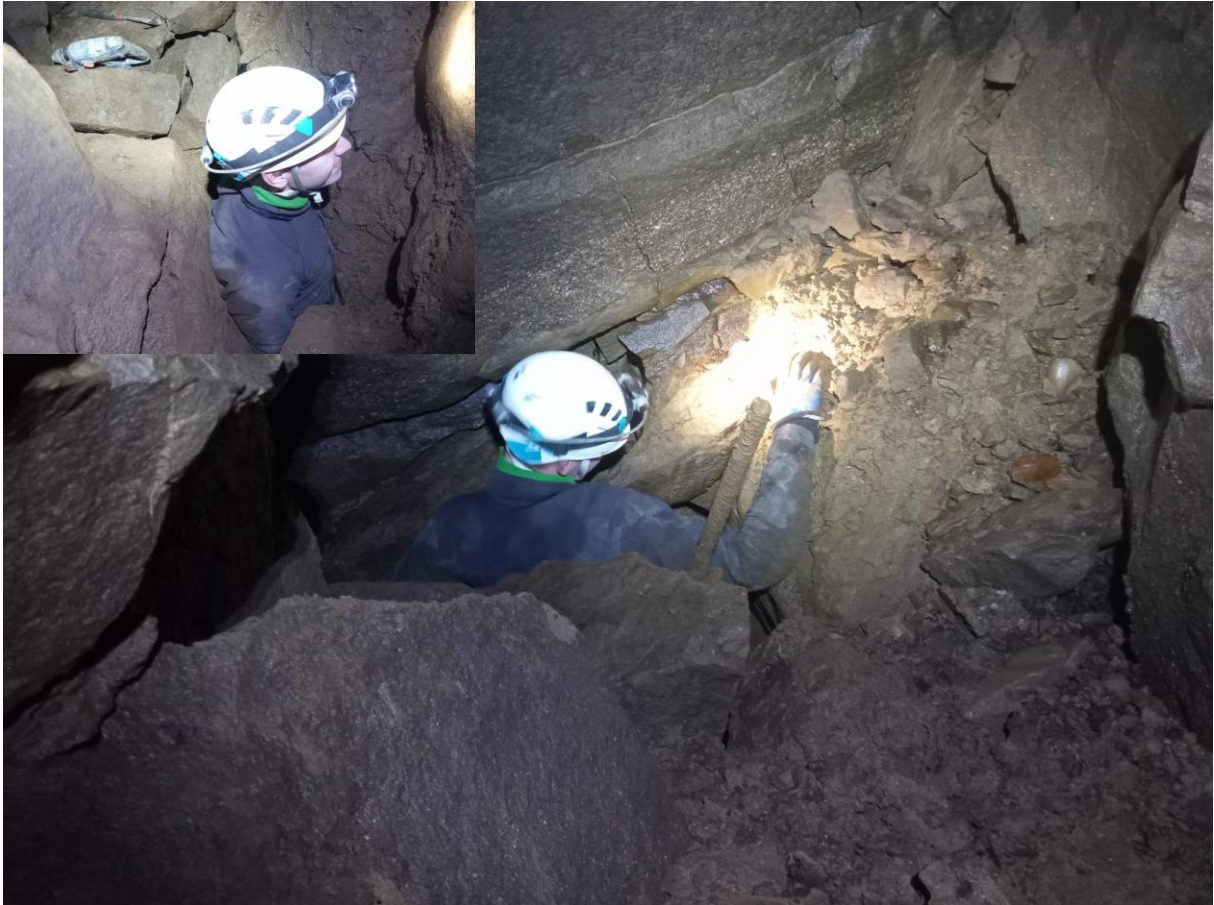
Zejście do dolnego zawaliska