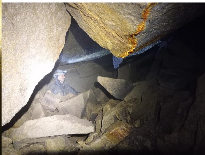
Sala z Kosmicznym Odwiertem

nietoperze. Nazwa powstała od długotrwałej eksploracji jaskini zanim udało się wejść do środka.