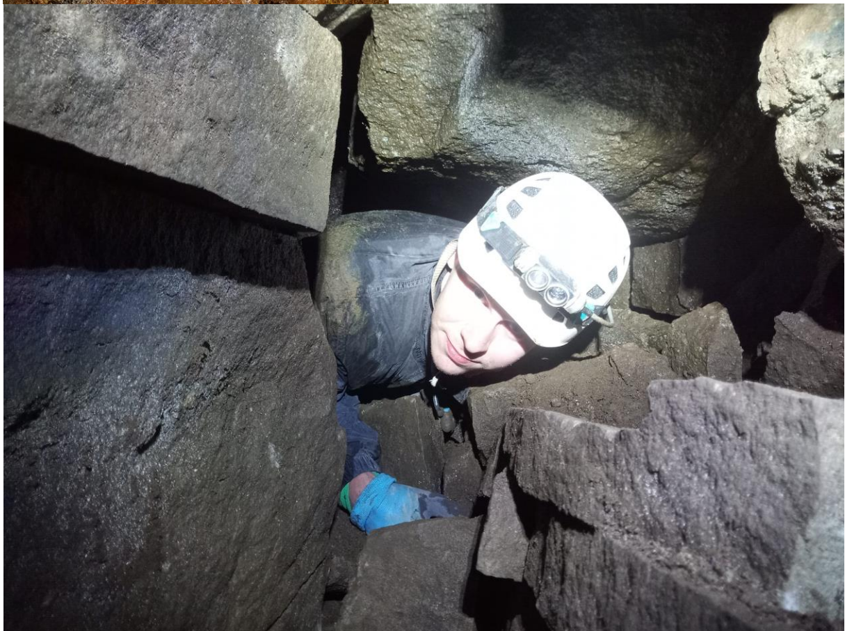
Przejście do dalszych partii