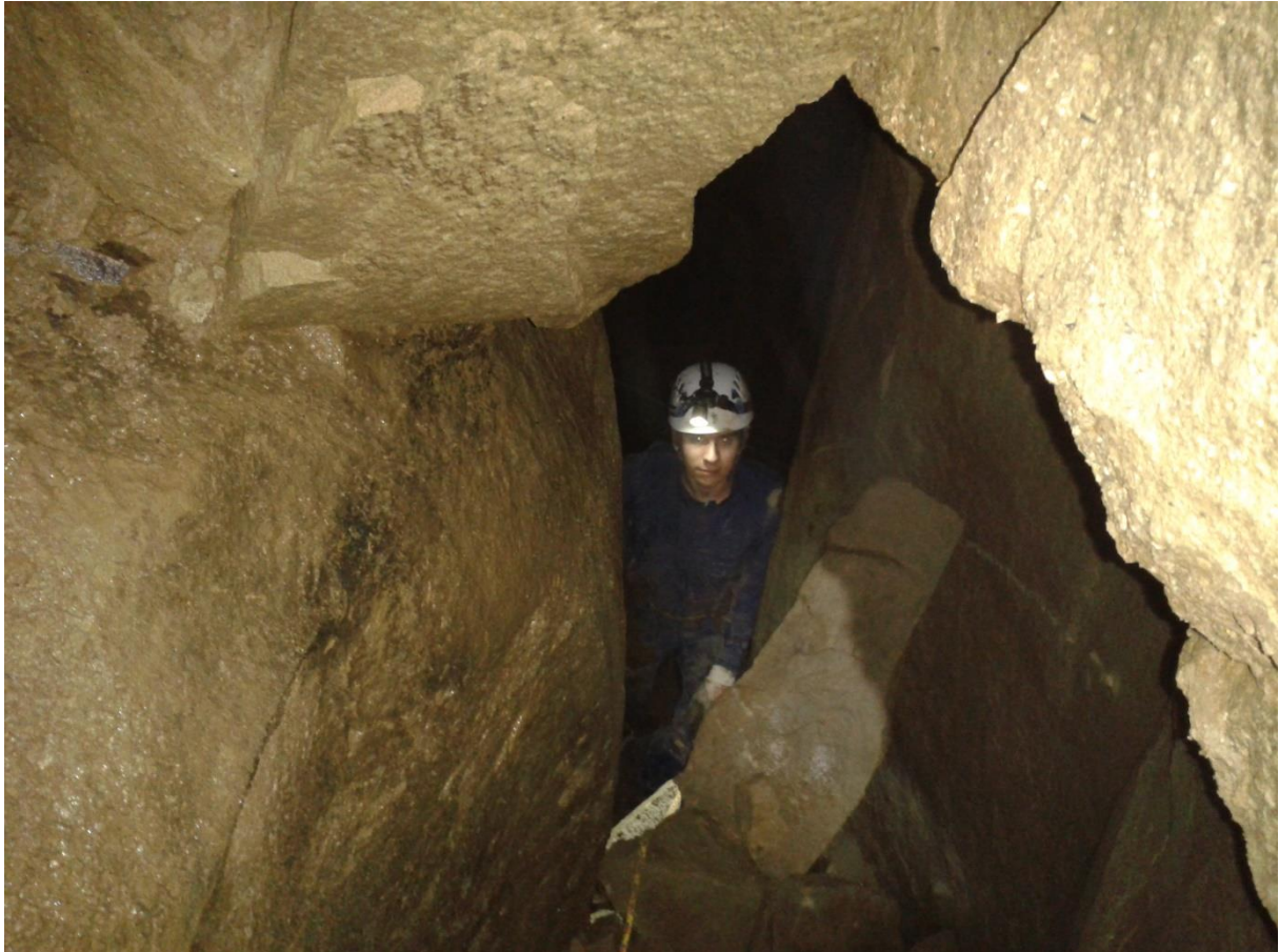
Wejście do Sali Wysokiej