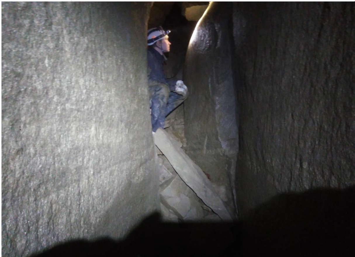
Wyjście z Sali Wysokiej