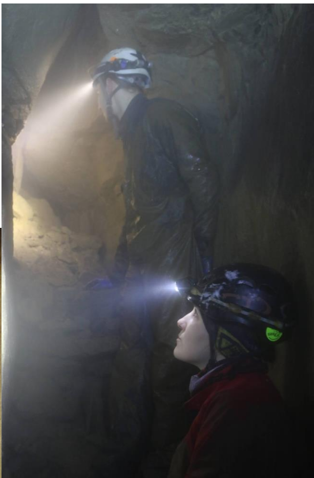
Mgła w Sali Wysokiej